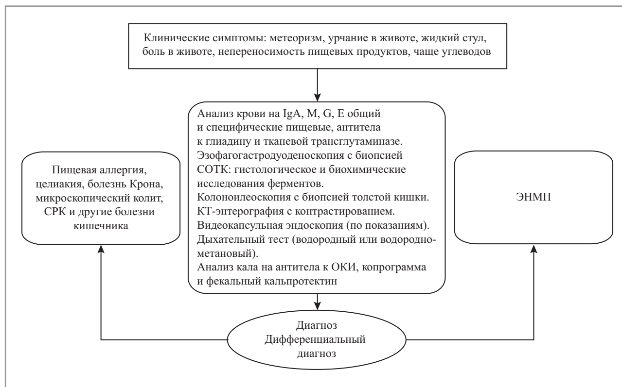
Рис. 3. Алгоритм диагностики ЭНМП.

Для исключения пищевой аллергии применяют панель с пищевыми аллергенами. Дифференциальный диагноз с целиакией и аутоиммунной энтеропатией проводят на основании данных серологических и гистологических исследований крови и СОТК. Болезнь Крона исключают с помощью эндоскопии кишечника, в том числе с использованием видеокапсулы, позволяющей обнаружить ее ранние проявления [44]. Определенные трудности представляет диагностика микроскопического (лимфоцитарного и коллагенозного) колита у больных хронической диареей, так как требуется выполнение топографической биопсии слизистой оболочки из всех отделов толстой кишки. Следует подчеркнуть, что у пациентов с перечисленными заболеваниями можно обнаружить недостаточность МП, но только нозологический диагноз является правильным путем к успешному лечению. В этом плане исключением являются